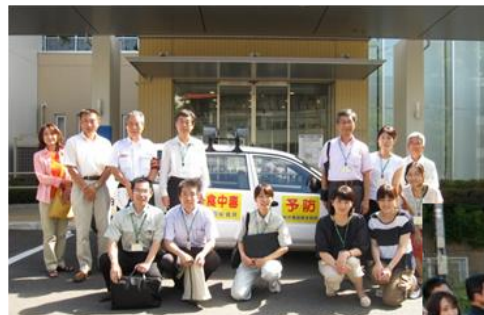
食中毒予防パレード