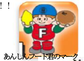
あんしんフード君のマーク

ノロウイルス食中毒に幅広く対応する 「あんしんフード君」(総合食品賠償共済)で備え万全！